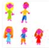
Möhlig, Fabienne 13 Jahre